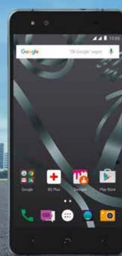
BQ Aquaris X5