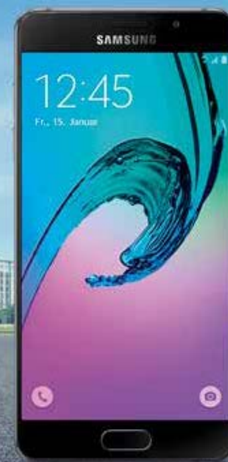
Samsung Galaxy A5 (2016)